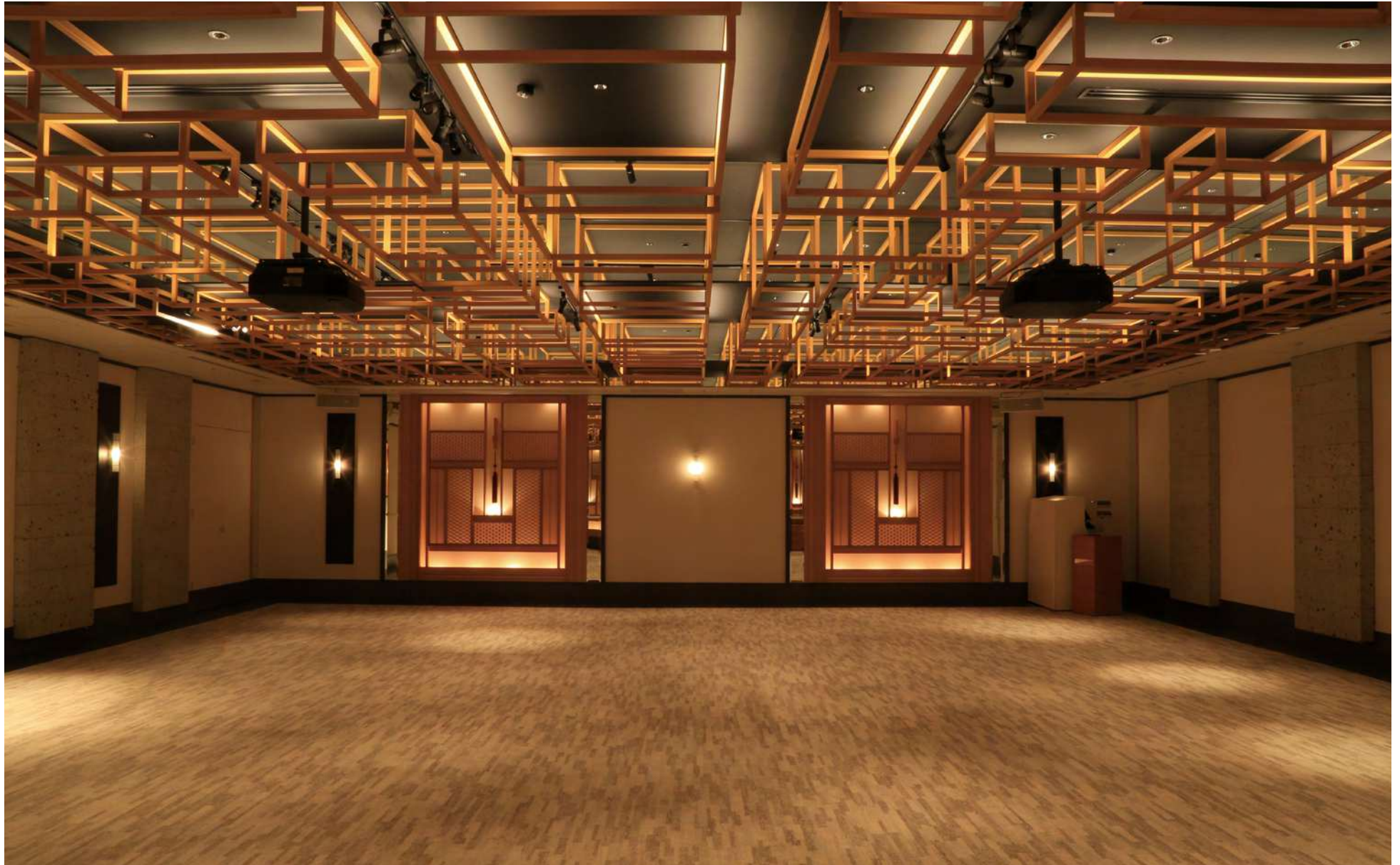
リーフ / LEAF