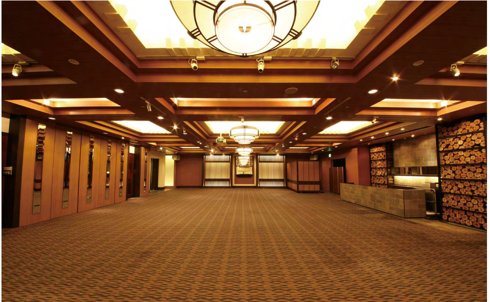
ウインド / WIND