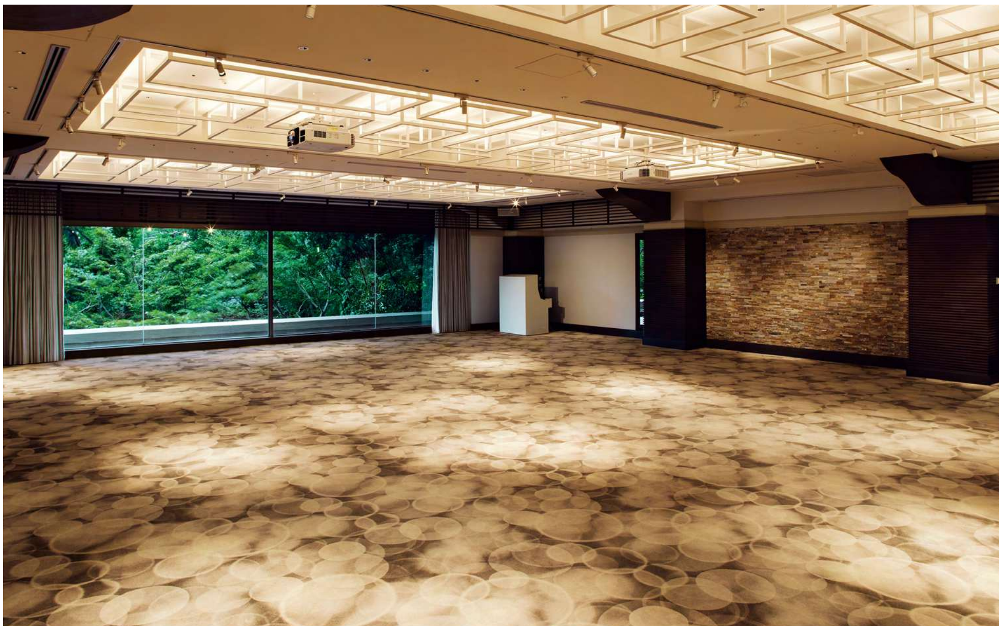
サンライト / SUNLIGHT