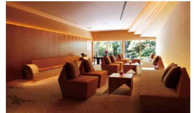
ロビー / Lobby