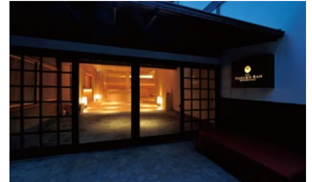
正面玄関 / Main Entrance