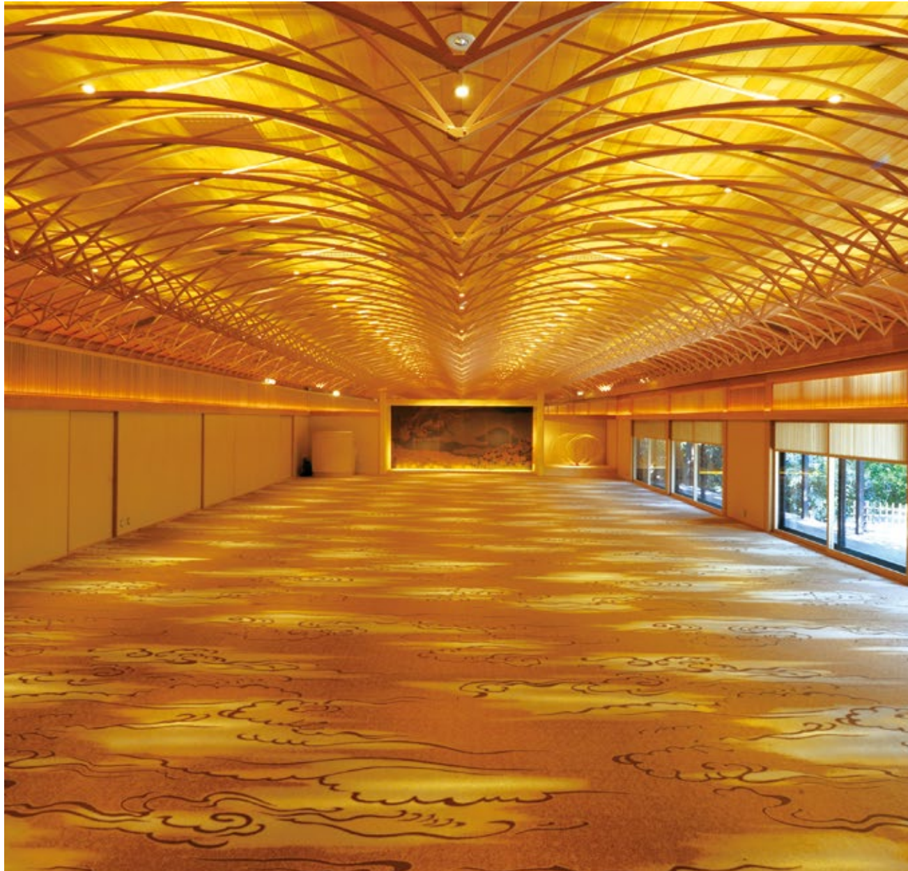
正装スタイルでは120名の着席が可能 / Formal dinner seating for up to 120 guests