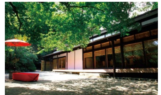
前庭 / Front garden