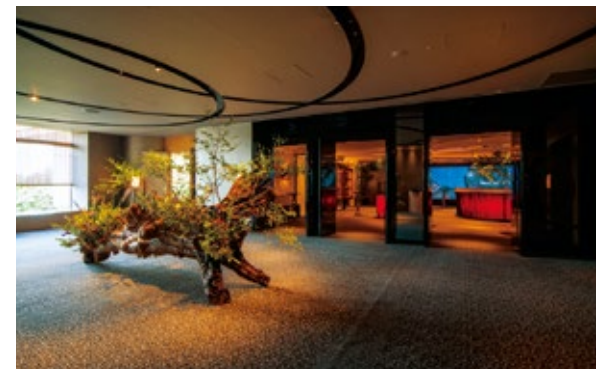
ロビー / Lobby