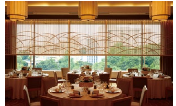
サクレ / SACRÉ