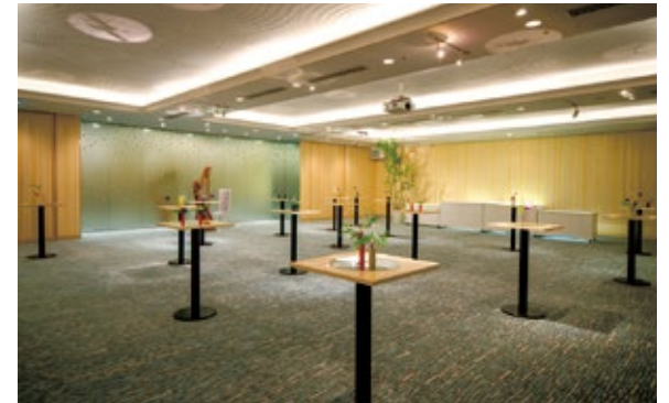
エタニティー / ETERNITY