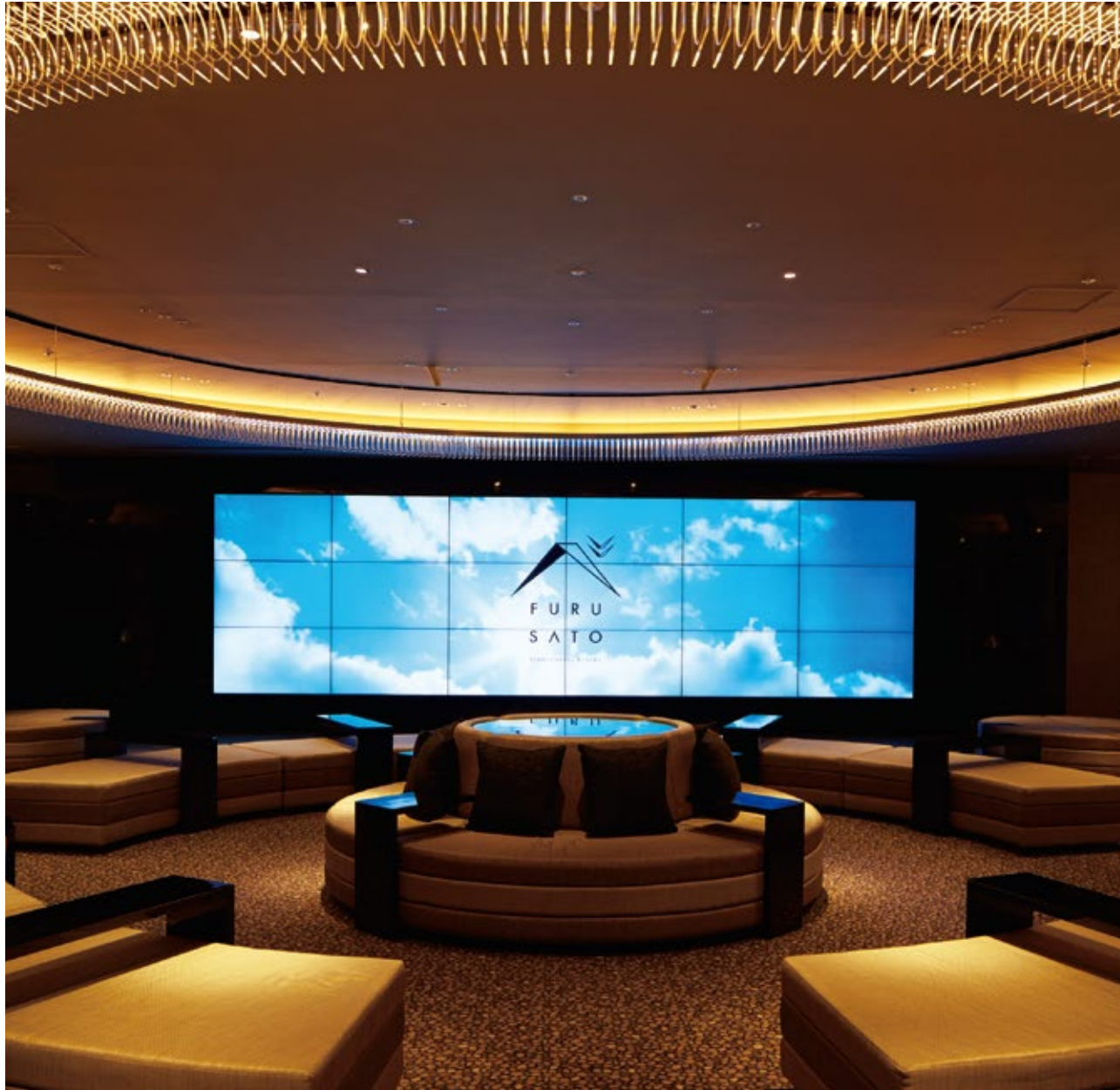
ノクターン / NOCTURNE